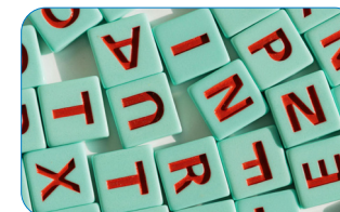
Groupe de parole