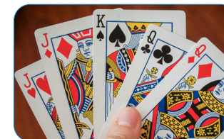
Jeux de carte