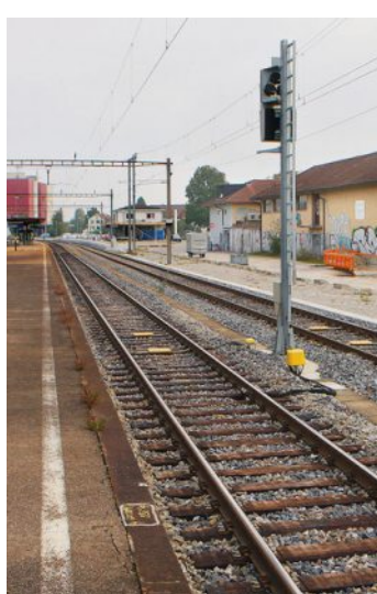
Les quais de la gare de Busswil vont être rehaussés.

A la Worbenstrasse et la Länggasse, les conduites électriques et les canalisations seront également assainies. Pour l'ensemble des travaux, les coûts s'élèvent à 5 millions de francs, partagés entre la commune et les CFF. C-JGA