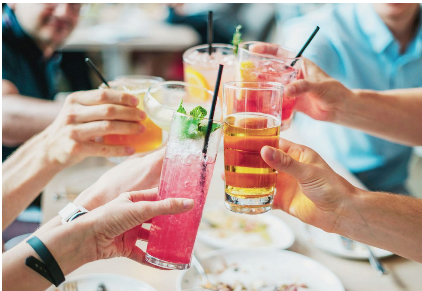
La deuxième édition de la version suisse du Dry January regroupe plusieurs associations afin de mieux sensibiliser la population.

Le Dry January trouve son origine en 2013 au Royaume-Uni sur l'initiative de l'organisation Alcohol Change UK. «Nous avons lancé l'action en Suisse avec d'autres partenaires parce que la prévention contre l'abus d'alcool entre parfaitement